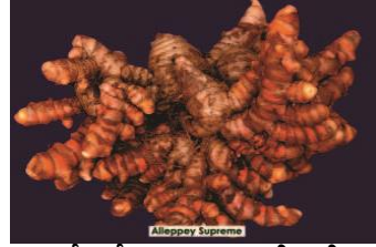
आईआईएसआर आलप्पी सुप्रीम